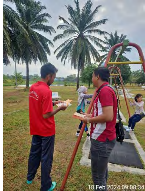
KAW. TUMPUAN AWAM 2 KALI SEBULAN