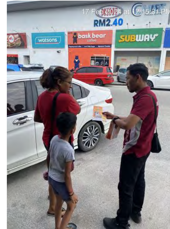
KAWASAN KOMERSIAL SEKALI SEBULAN