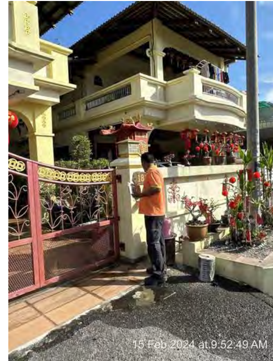
KAWASAN KEDIAMAN 2 KALI SEBULAN