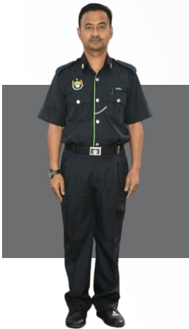
Jabatan Perkhidmatan Kesihatan