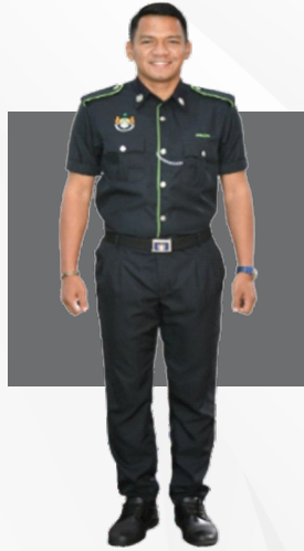
Jabatan Perkhidmatan Perbandaran