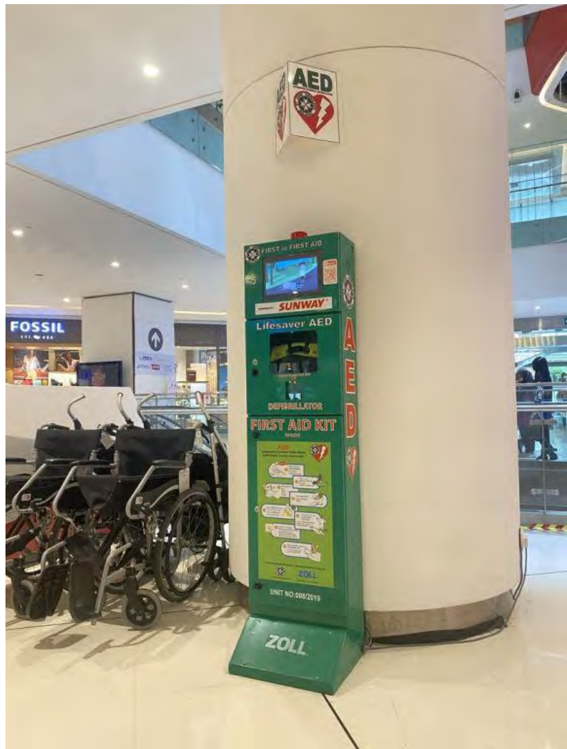
Gambar 3: Contoh pemasangan alat AED di tempat awam